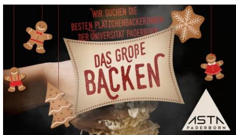
Veranstaltungslayout "Das Große Backen Universität Paderborn"

Die Preise „1. Platz 100 € Bar + T-Shirt, 2. Platz 50 € Bar + T-Shirt, 3. Backbuch + T-Shirt“ wurden unter dem Einverständnis des Teams durch die Aufwandsentschädigung des WDR5 Quizmaster finanziert.