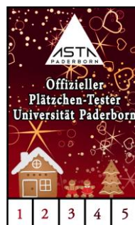
Plätzchentester Karte für Studierende und Mitarbeiter der Universität