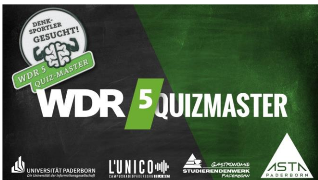
Veranstaltungslayout WDR5 Quizmaster Universität Paderborn